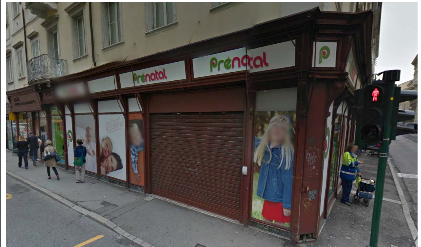
RIPRESA FOTOGRAFICA DEL FABBRICATO DA VIA ROMA