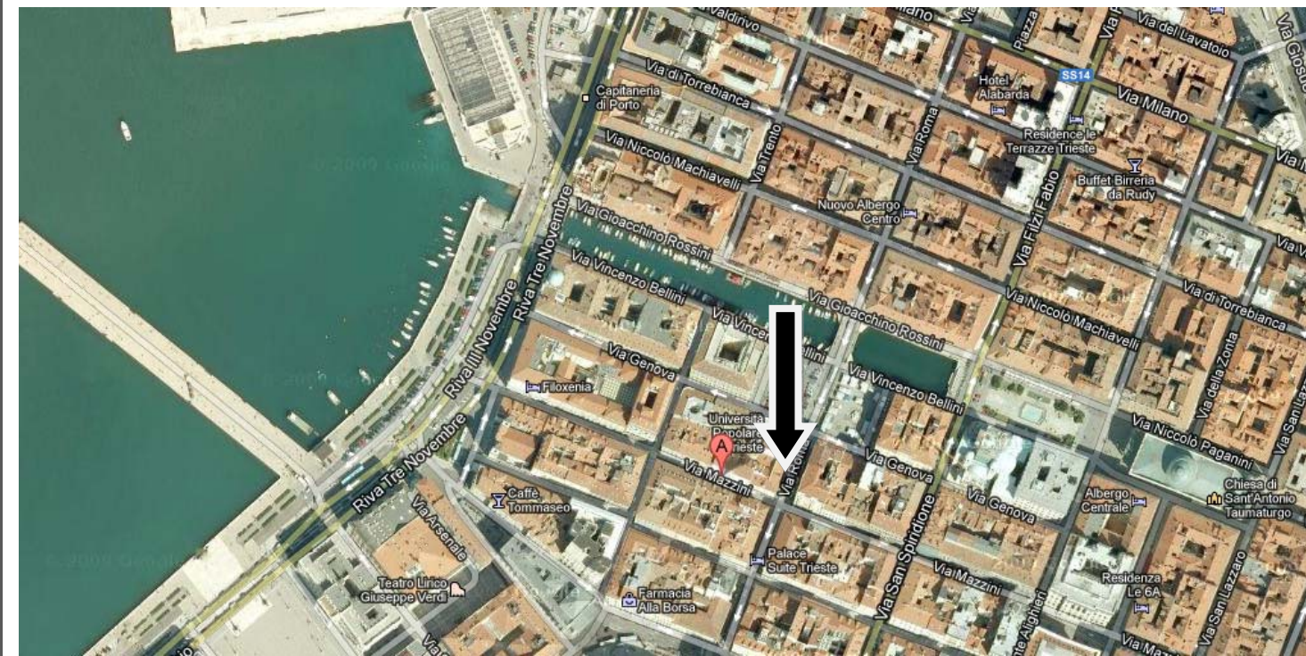
FOTOGRAFIA AEREA DELL'AREA